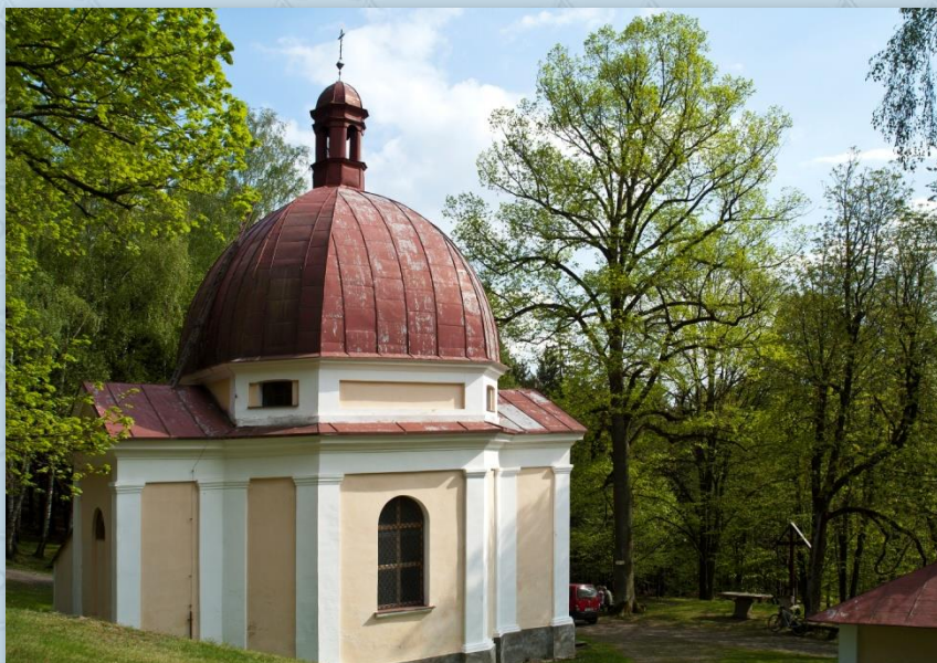
Dobrá voda - kostel

Asi po 1,5 km je odbočka vlevo, po které se dostaneme k poutnímu místu Dobrá voda. Na kraji Libkova odbočíme doprava, kolem sportovního areálu a pokračujeme po trase č. 2088. V nejvyšším místě cesty, v zatáčce je odbočka doleva. Tato cesta vede na vrcholek s kostelíkem Sv. Markéty a rozhlednou, odkud je úžasný výhled do okolí.