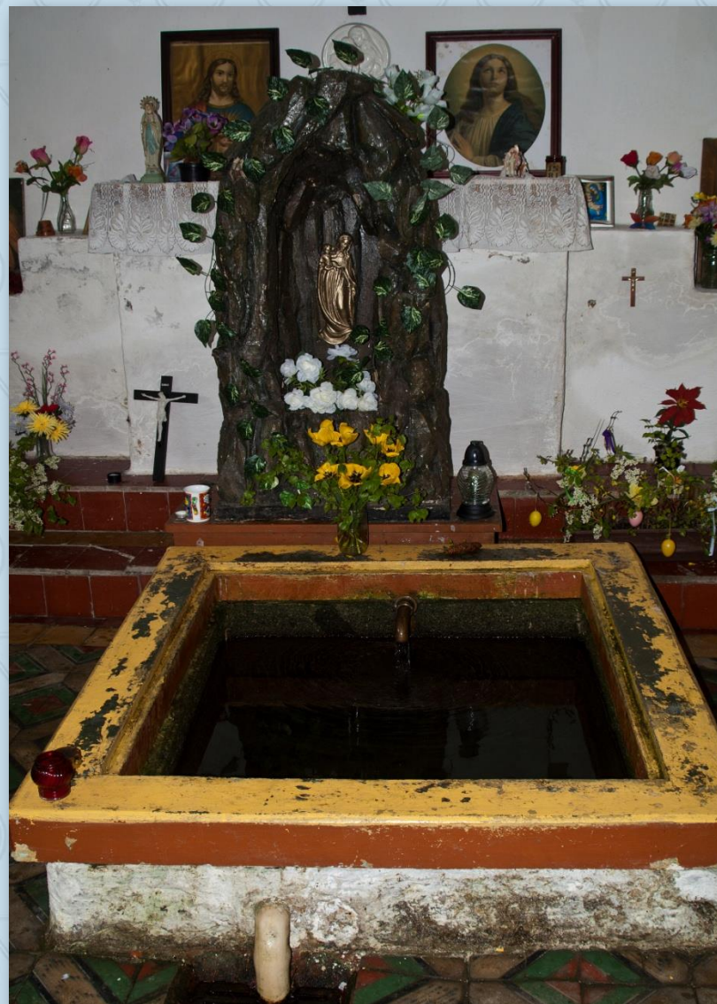
Dobrá voda - pramen

Nedaleko odtud se popásali koně, když stará slepá kobyla zabloudila do lesa ke studánce. Šlápla přední nohou do pramene a voda, která vystříkla kobyle do očí, jí vrátila zrak. Svědky této příhody byli pastevcí, kteří spěchali koni na pomoc. Zvěst o této příhodě se rychle rozlétna po kraji a ke studánce začaly proudit davy poutníků, aby zde našly ztracené zdraví. U studánky vyrostla v 17. století dřevěná kaplička, kam uzdravení věšeli obrázky o svém vyléčení. V roce 1908 však i s obrázky vyhořela. Na jejím místě nad pramenem byla pak postavena zděná kaplička obdélníkového půdorysu, s půlkruhovými okénky a nízkou stříškou.